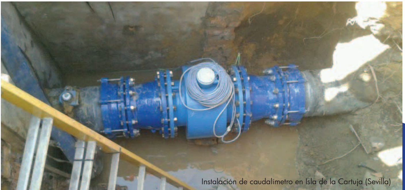
Instalación de caudalímetro en Isla de la Cartuja (Sevilla)