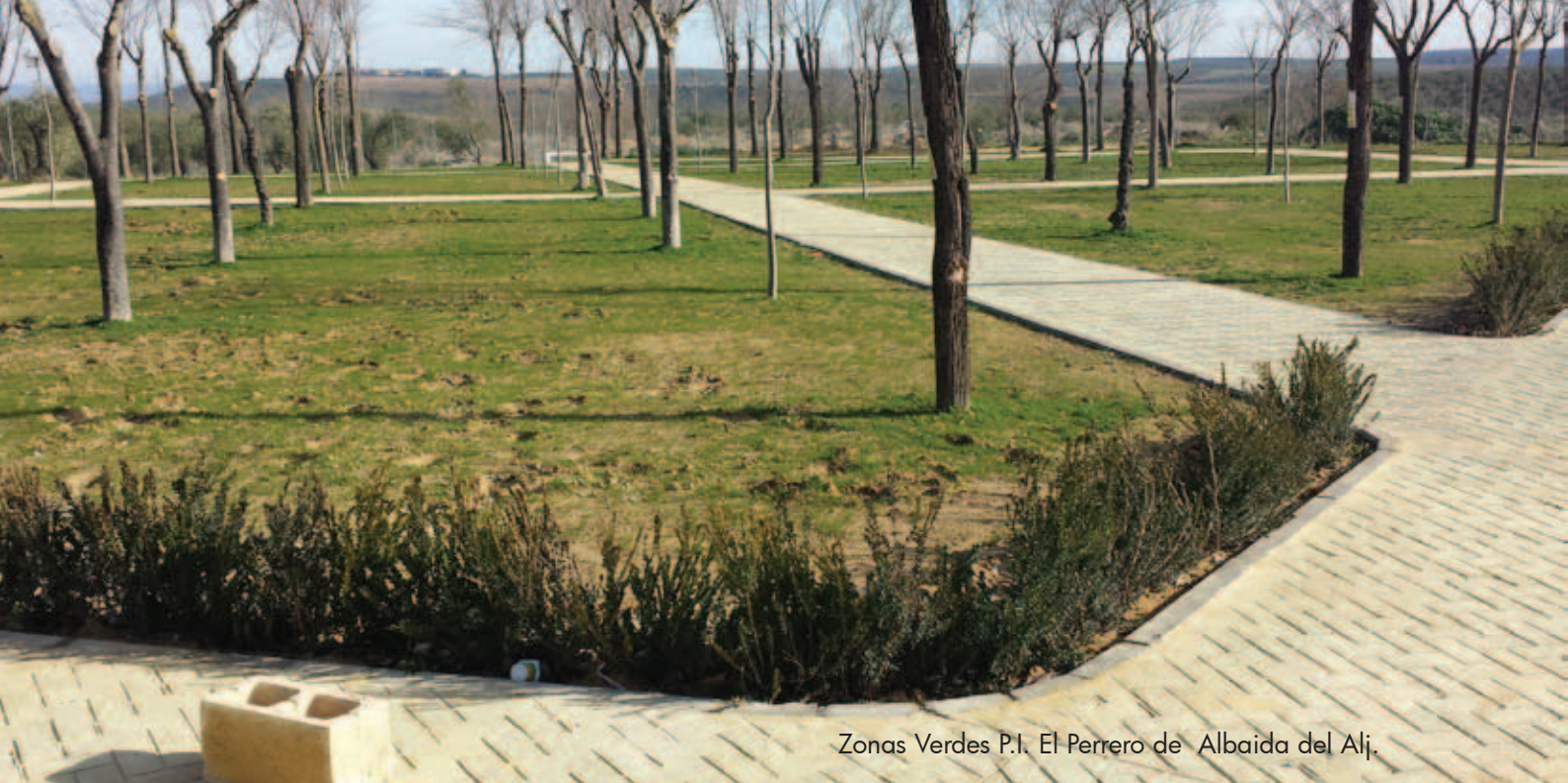
Zonas Verdes P.I. El Perrero de Albaida del Alj.