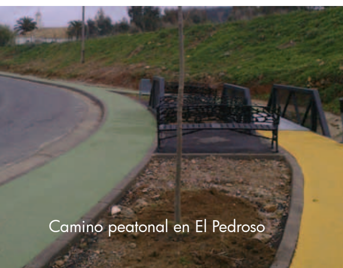
Camino peatonal en El Pedroso