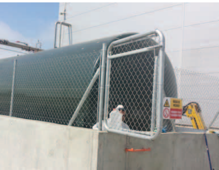
Reurbanización P.I. La Era Empedrada de Umbrete (Sevilla)