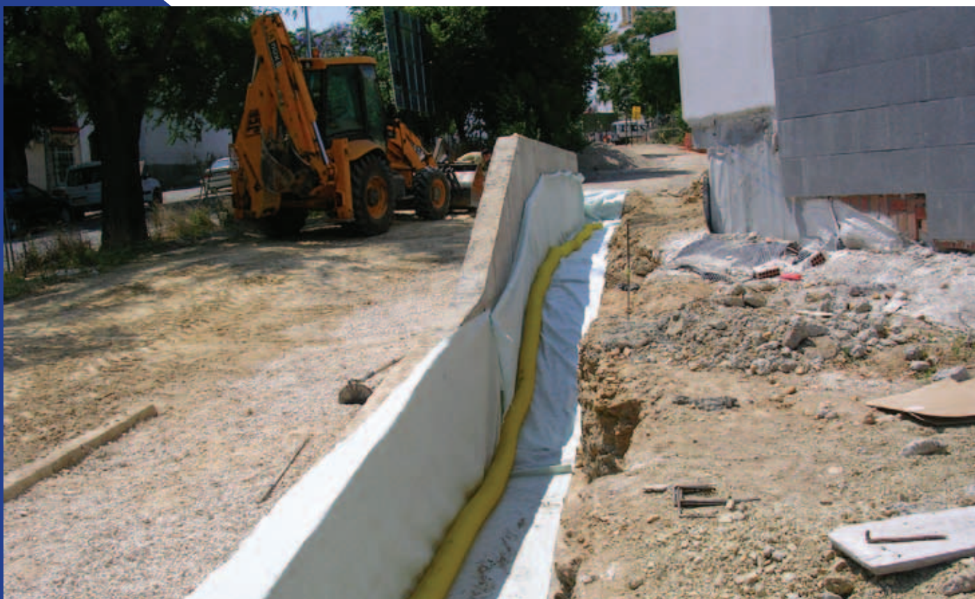
Construcción de Muro y drenaje en Teatro de Arahal