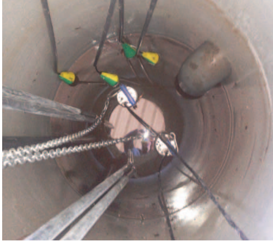
Instalación de Bombas de extracción en Planta Enagás en Almodóvar del Río (Sevilla)