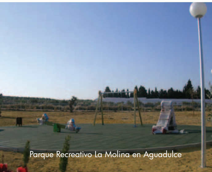
Parque Recreativo La Molina en Aguadulce