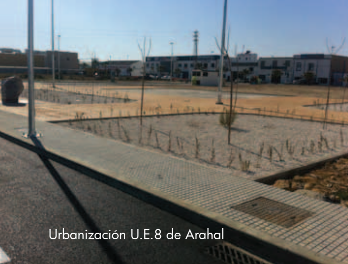
Urbanización U.E. 8 de Arahal