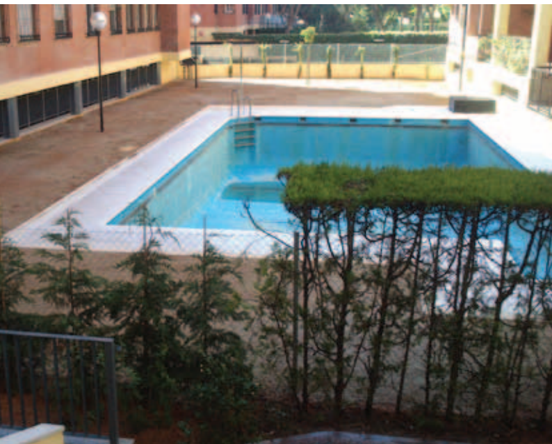
Reforma en Edificio Calle Cortegana