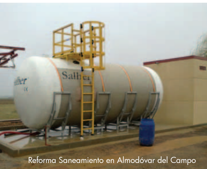
Reforma Saneamiento en Almodóvar del Campo